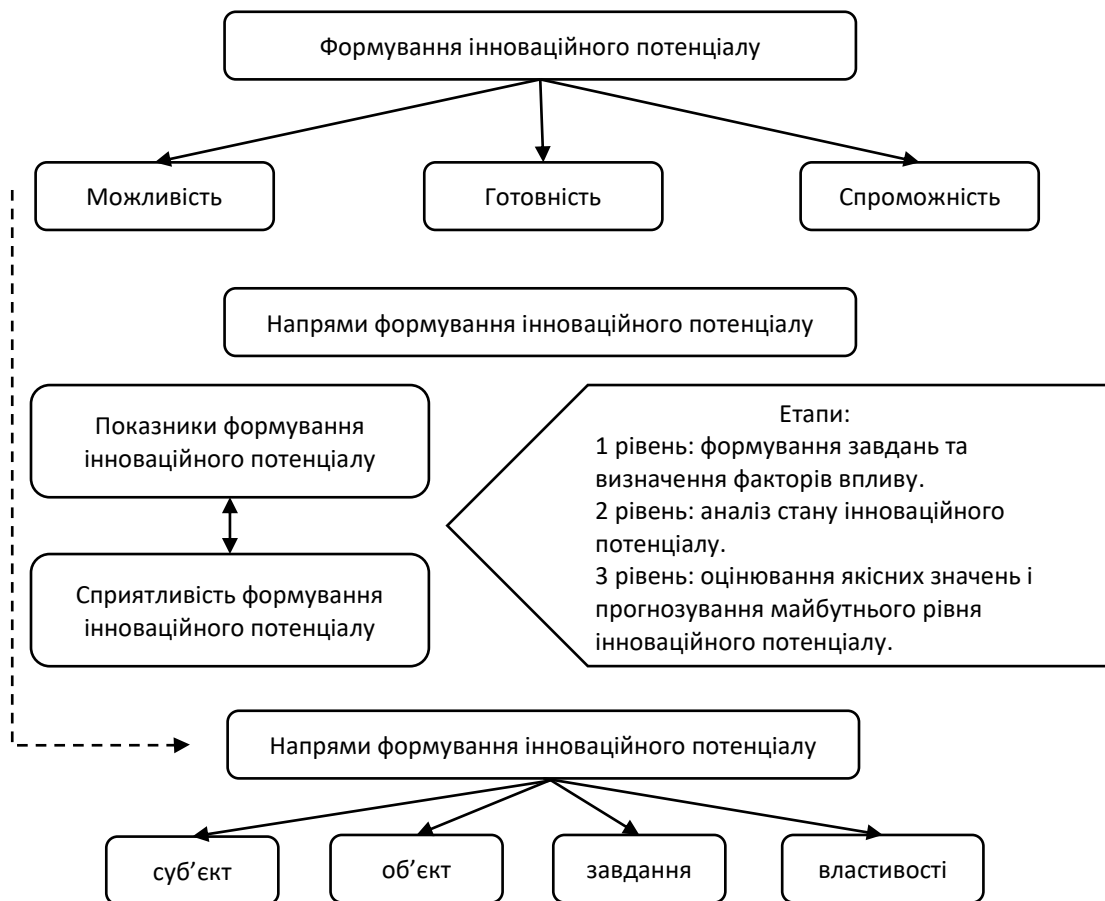
Рисунок 1 – Конфігурація формування інноваційного потенціалу

Виклад основного матеріалу дослідження. Формування інноваційного потенціалу ґрунтується на ряді складових, які представлені у виді його конфігурації (рис. 1).