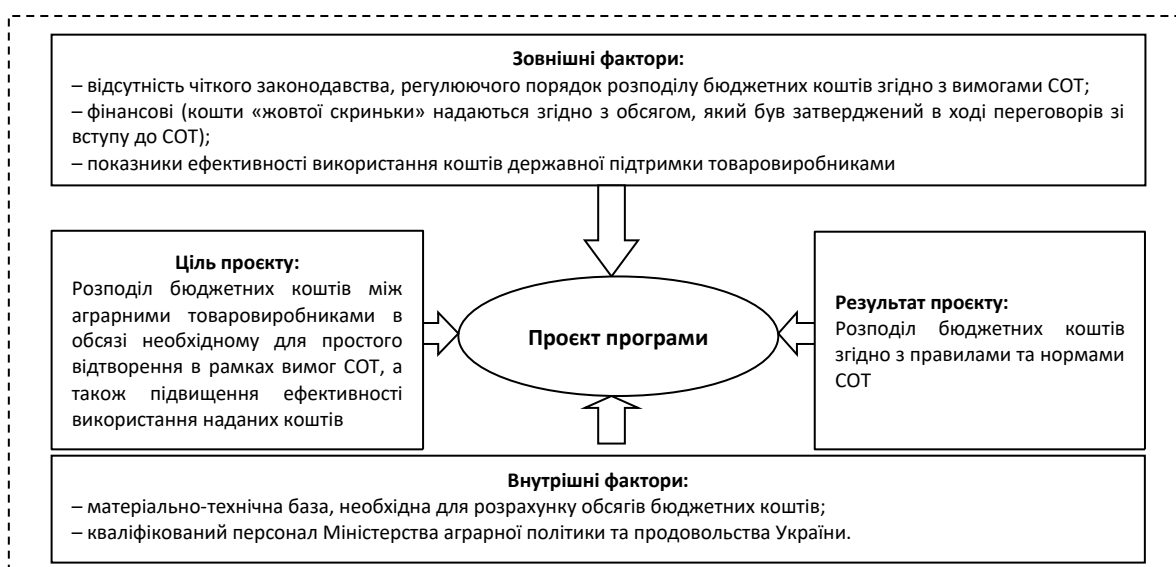
Рисунок 1 – Основні фактори, що впливають на цільові елементи системи субсидування аграрного сектору економіки

Об'єктом програми є аграрні товаровиробники, умови їх функціонування та результати фінансово-господарської діяльності. Суб'єктами програми є органи місцевого самоврядування, Міністерство аграрної політики та продовольства України, його департаменти та комітети, Міністерство фінансів. З точки зору системного підходу механізм (проект) – це процес переходу з початкового стану в кінцевий, тобто результат, досягнутий за допомогою низки механізмів та обмежень (рис. 1).