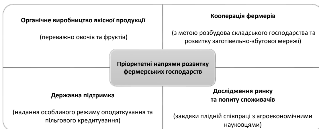
Рисунок 3 – Пріоритетні напрями розвитку виробничої діяльності фермерських господарств України