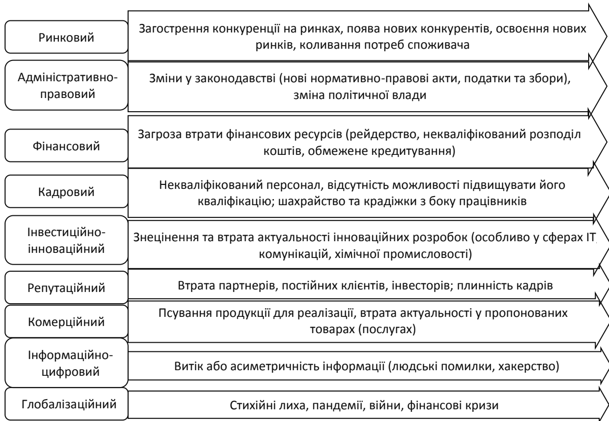
Рисунок 1 – Сучасні основні групи ризиків господарської діяльності малих підприємств в Україні

Джерело: складено на основі [5; 6, с. 179; 7, с. 91]