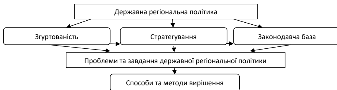
Рисунок 1 – Алгоритм вдосконалення державної регіональної політики

В Україні до 2014 р. була відсутня ефективна державна регіональна політика та застосовувалася традиційна політика щодо балансування економічного розвитку через тимчасове покриття розбіжностей між регіонами. Реалії сьогодення вимагають від держави виявлення та реалізації не врахованого потенціалу розвитку регіонів.