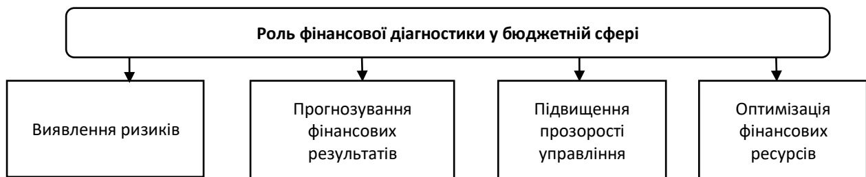
Рисунок 1 – Роль фінансової діагностики у бюджетній сфері

Фінансова діагностика — це процес оцінки фінансового стану установи або підприємства з метою виявлення проблемних зон і можливостей для оптимізації [1]. У бюджетній сфері цей інструмент дозволяє аналізувати стан державних фінансів, виявляти слабкі місця та оцінювати ризики, які можуть вплинути на виконання бюджету (рис.1).