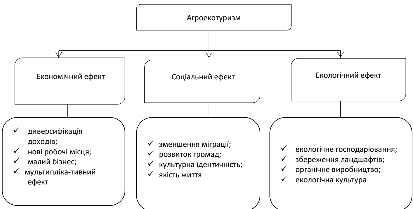
Рисунок 1 – Комплексний вплив агроекотуризму на сталий розвиток сільських територій

Представлена модель комплексного впливу агроекотуризму (рис. 1) підтверджує його системну роль у розвитку сільських територій. Практична реалізація зазначених ефектів проявляється у зростанні бюджетних надходжень. Водночас активізується розвиток суміжних галузей, зокрема транспорту, торгівлі, громадського харчування та сфери послуг, що формує мультиплікативний ефект для регіональної економіки.