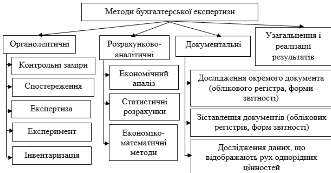
Рисунок 2 – Методи бухгалтерської експертизи, прийняті у вітчизняній практиці

(облікового реєстру, форми звітності) включає його формальну, арифметичну, хронологічну, нормативно-правову перевірку; зіставлення документів (реєстрів, форм звітності) може проводитися шляхом зустрічної чи взаємної перевірки, аналітичної й логічної перевірки; дослідження даних, що відображають рух однорідних цінностей, передбачає відновлення кількісно-сумового обліку, контрольне порівняння залишків, дослідження фактів за кінцевою операцією [12].