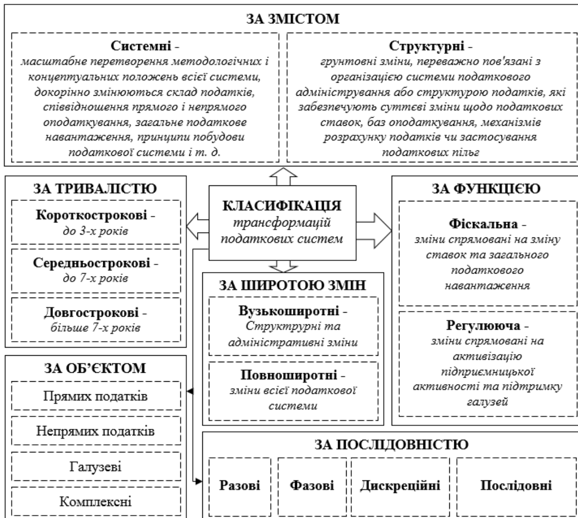
Рисунок 2 – Класифікація трансформацій податкових систем*

узагальнено проаналізовану інформацію на рис. 2.