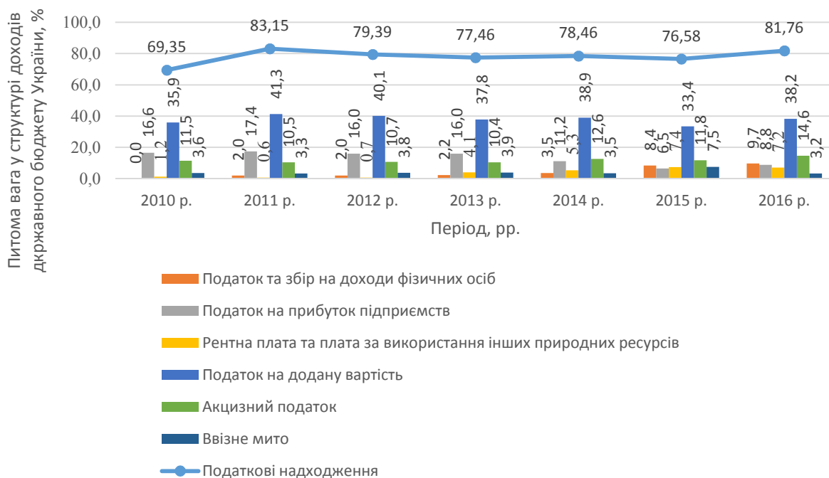
Рисунок 1 – Динаміка питомої ваги основних бюджетотворюючих податків у структурі державного бюджету України за 2010-2016 рр.

Джерело: узагальнено автором на основі даних [6]