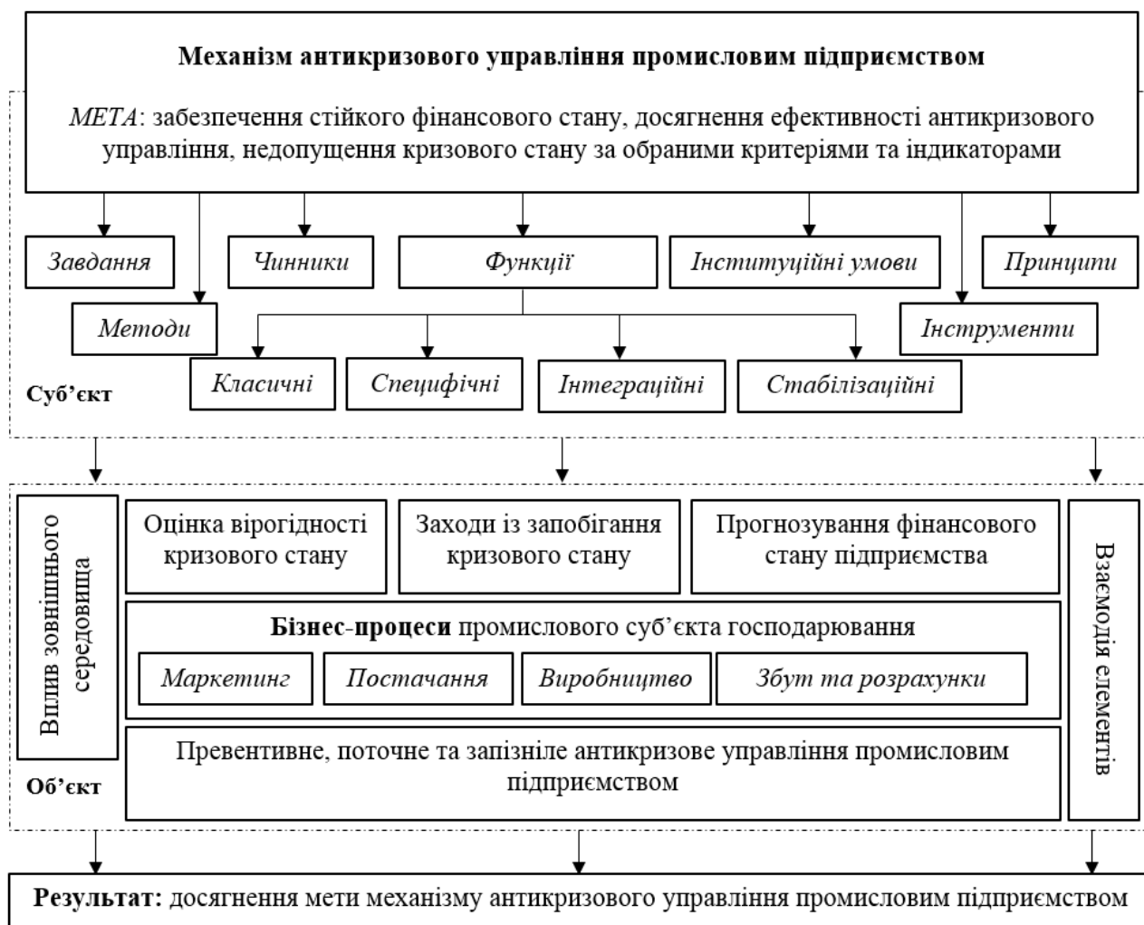
Рисунок 2 – Механізм антикризового управління промисловим підприємством