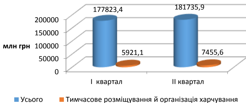
Рисунок 1 – Динаміка обсягу реалізованих послуг підприємствами ресторанного бізнесу (у ринкових цінах), млн грн (за кварталами)