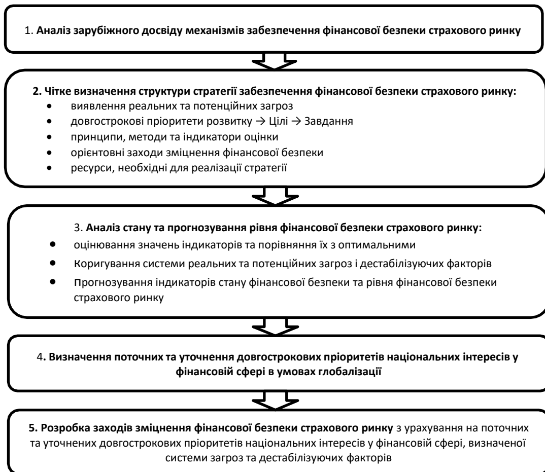
Рисунок 4 – Етапи розробки стратегії забезпечення фінансової безпеки страхового ринку

безпеки страхового ринку через наявність внутрішніх та зовнішніх загроз. Першочерговими з них мають стати: відновлення довіри до страхової галузі серед населення; забезпечення функціонування ефективного механізму захисту прав споживачів страхових послуг; створення дієвої системи внутрішнього контролю та управління ризиками, що забезпечуватиме виявлення, моніторинг, контроль, звітування та мінімізацію всіх суттєвих ризиків для діяльності страхової компанії; розробка та виконання плану відновлення рівня достатності капіталу в разі невиконання вимог до платоспроможності; оптимізація законодавства у сфері нагляду та регулювання страхового ринку, яке базуватиметься на основних вимогах законодавства ЄС до страхових компаній та перестраховиків, та враховуватиме особливості національного страхового ринку; застосування сучасних технологій і стандартів інформаційної безпеки в процесі формування та подання звітності страхових компаній з метою належної оцінки ризиків їх діяльності та дотримання регуляторних вимог тощо.