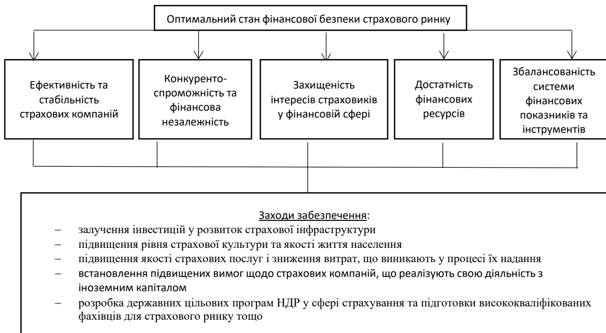
Рисунок 1 – Ключові аспекти оптимального стану фінансової безпеки страхового ринку України

Забезпечення оптимального стану фінансової безпеки страхового ринку сприятиме зміцненню фінансової безпеки держави в умовах глобалізації, реалізації фінансових інтересів на міжнародному рівні. Крім того, за цих умов буде реалізована роль страхування як у розвитку фінансового ринку, так і сприянні стійкості економічного зростання України.