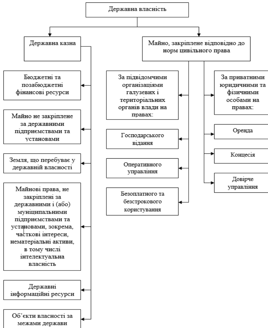
Рисунок 2 – Державна власність як економічна система за складом майнових прав

2. Як суб'єкта та об'єкта мікроекономічного управління, зокрема як суб'єкта договірних відносин з різними організаціями, а саме виступає в ролі особи державних організацій. Функції держави як суб'єкта управління (в особі законодавчих, виконавчих і судових органів) полягають у розробці законів та інших нормативних актів, що визначають правові межі господарської діяльності, і в контролі за їх виконанням. Система управління державною власністю, що належить до соціально-економічної системи, має здатність і прагнення до ціле утворення, тому що у системах, де участь бере людина, цілі утворюються всередині системи, а в закритих, або технічних, системах цілі задаються ззовні [4, с. 42]. У широкому розумінні цілі можна визначити як бажаний результат дії, функціонування чи розвитку системи. За допомогою класифікації цілей є можливість предметно визначити завдання мети й використовувати відповідні процеси та способи управління для різних груп цілей.