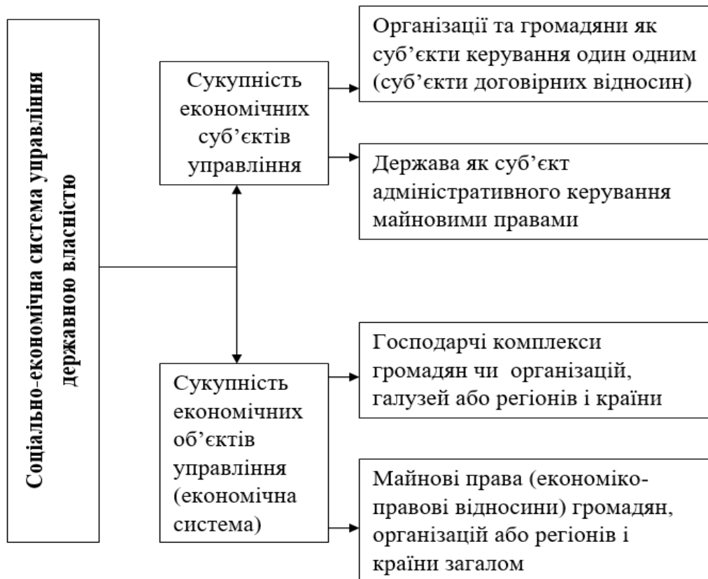
Рисунок – 1 Місце економічної системи державної власності в соціально-економічній системі управління

Для соціально-економічних систем дуже поширено таке визначення, як економічні суб'єкти та об'єкти, або суб'єкти та об'єкти економіки [1, с. 35-36].