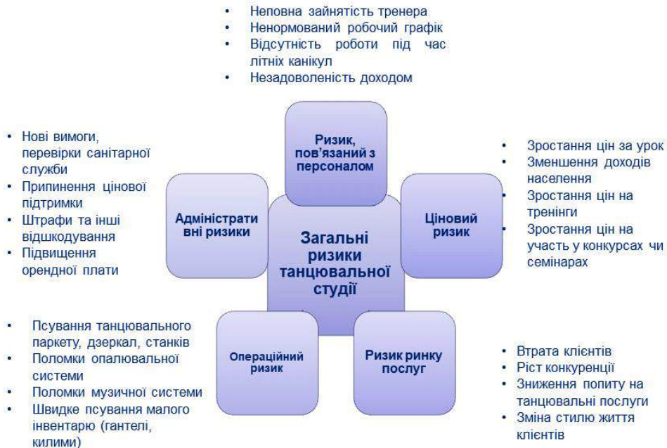
Рисунок 2 – Ризики, що впливають на розвиток танцювальних студій

Також, танцювальна студія може зіштовхнутися із низкою ризиків під час своєї діяльності. (рис. 2).