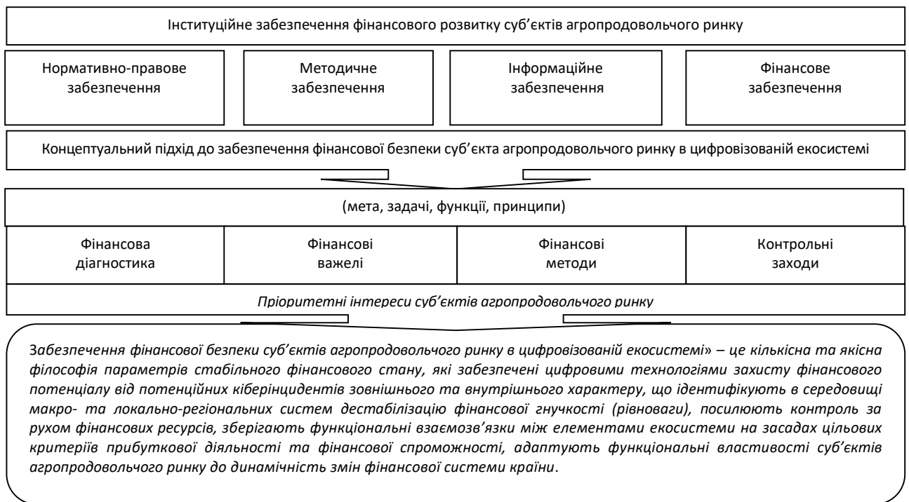
Рисунок 3 – Концептуальний підхід до визначення сутності фінансової безпеки суб'єктів агропродовольчого ринку в цифровізованій екосистемі

Для вирішення завдань нашого дослідження, визначено авторську інтерпретацію сутності економічної категорії «фінансова безпека суб'єкта в цифровізованій екосистемі». Вважаємо, що з позиції захисту від загроз та ризиків фінансова безпека суб'єкта в цифровізованій екосистемі – це сукупність оцифрованих фінансових інструментів здатних своєчасно попередити та захистити об'єкти фінансового потенціалу від кіберінцидентів, мобілізувати його фінансові можливості та забезпечити умови для стабільного функціонування суб'єкта. З позиції концептуального підходу щодо інституційного забезпечення фінансового розвитку суб'єкта, запропоновано авторську інтерпретацію терміну «фінансова безпека суб'єкта агропродовольчого ринку в цифровізованій екосистемі» (рис. 3).