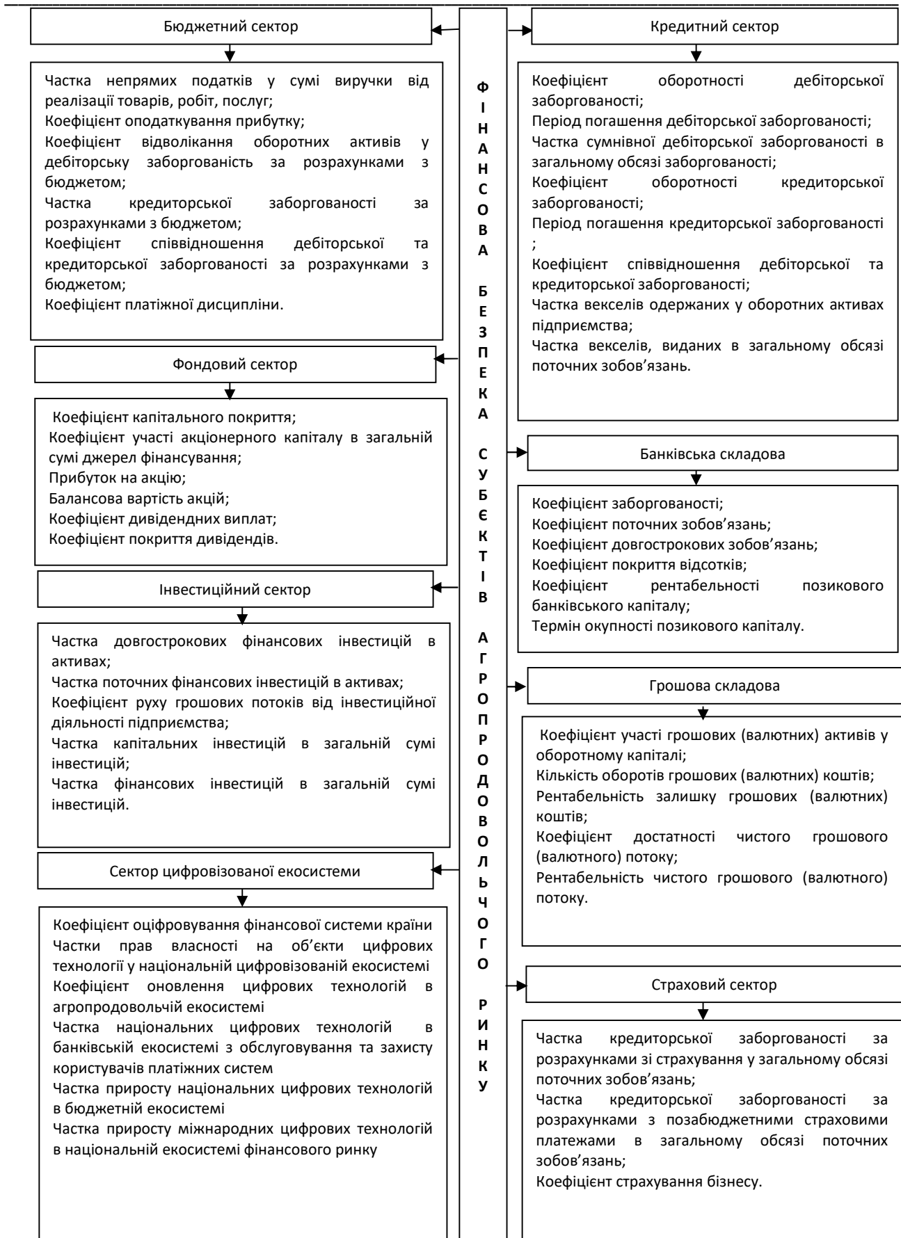
Рисунок 2 – Складові визначення фінансової безпеки суб'єктів агропродовольчого ринку

Джерело: удосконалено авторами за даними [1; 10; 33]