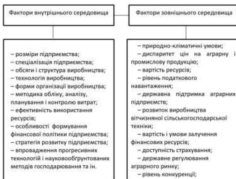
Рисунок 2 – Основні фактори впливу на формування витрат виробництва і реалізації сільськогосподарської продукції

Система управління витратами не може функціонувати без урахування факторів, які на неї впливають. Найчастіше ці чинники розподіляють на дві групи, а саме: фактори зовнішнього та внутрішнього середовища (рис. 2). Ступінь впливу різних факторів на формування витрат неоднаковий, може бути прямий або опосередкований. Однак, нехтування будь-яким з них може призвести до зниження ефективності господарювання [2].