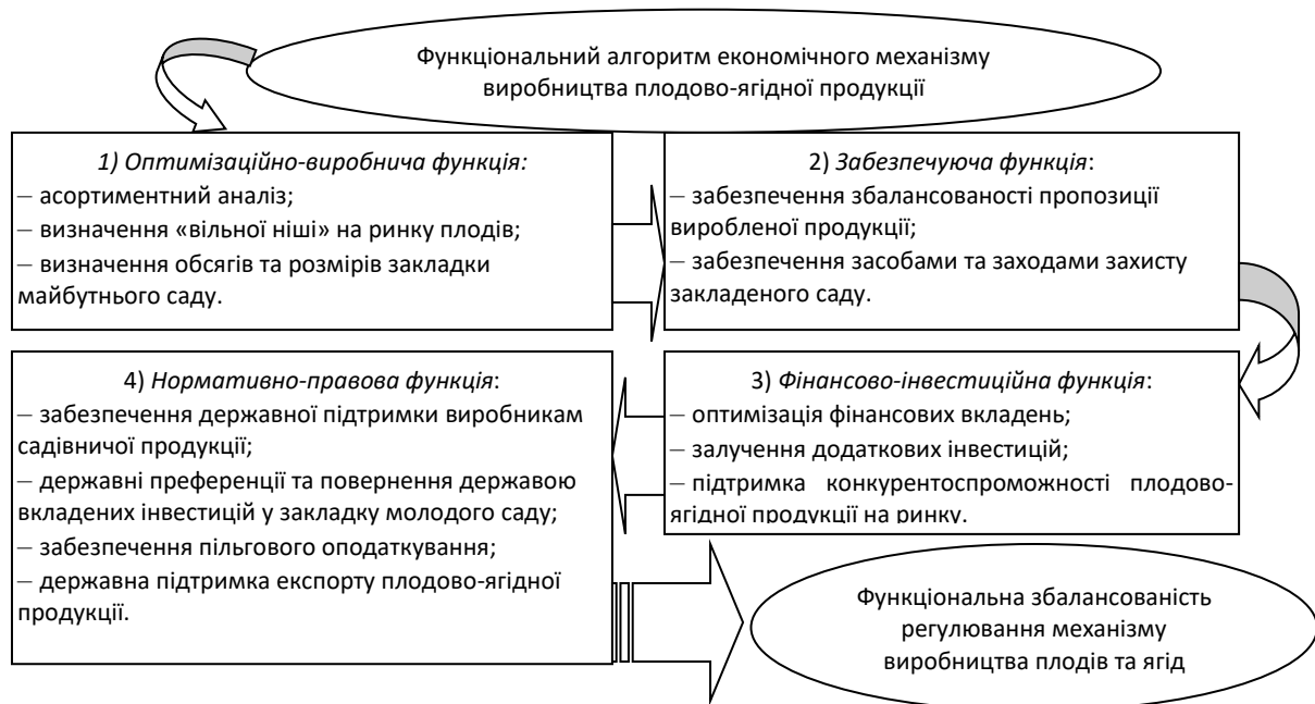
Рисунок 2 – Розроблений функціональний механізм виробничого регулювання плодово-ягідної продукції у сучасних умовах

Зважаючи на погляди багатьох вчених-економістів, висвітлених у наукових виданнях, пропонуємо власне виокремлення ряду функцій регулювання економічного механізму виробництва плодово-ягідної продукції у сучасних ринкових умовах. Розроблений функціональний алгоритм забезпечення економічного механізму представлений на рис. 2.