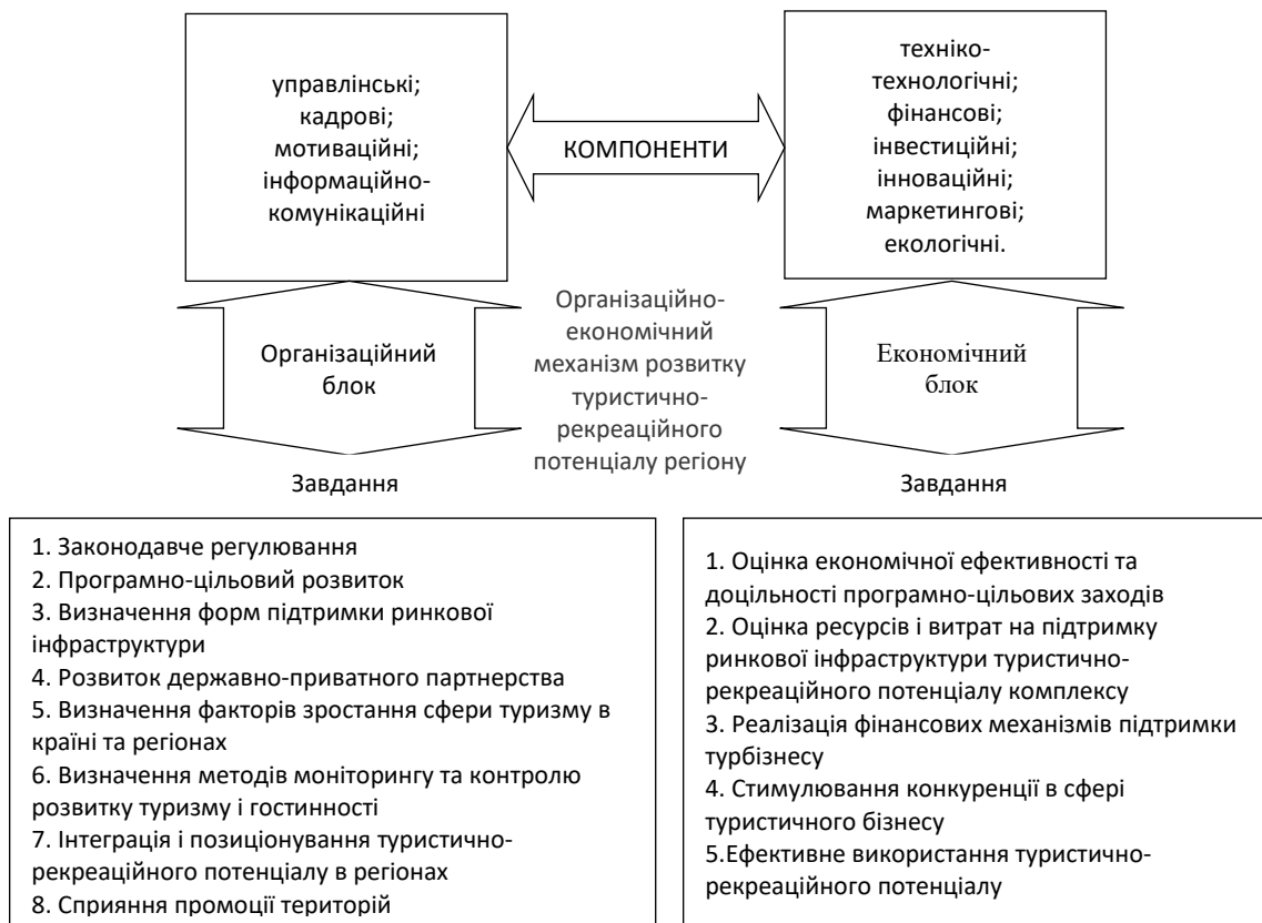
Рисунок 2 – Механізм організаційно-економічних компонент та завдань розвитку туристично-рекреаційного потенціалу регіону

Сукупність завдань формування розвитку складових його компонент можна розділити на два туристично-рекреаційного потенціалу регіону та блоки: організаційний та економічний (рис. 2).